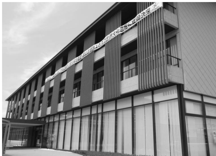
カメラステージ図書・歴史資料館