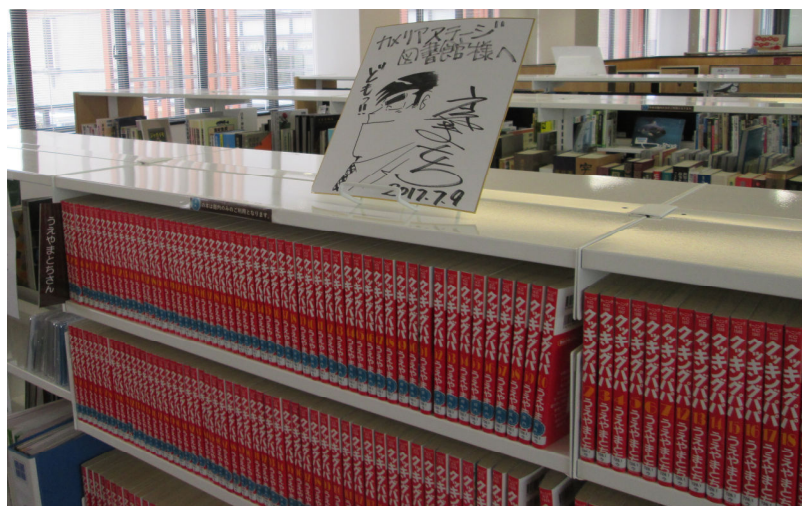
カメリアステージ図書館 うえやまとちコーナー