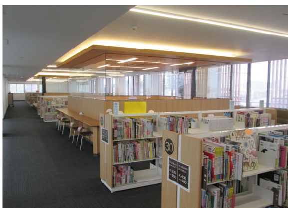
カメラステージ図書館 開架室